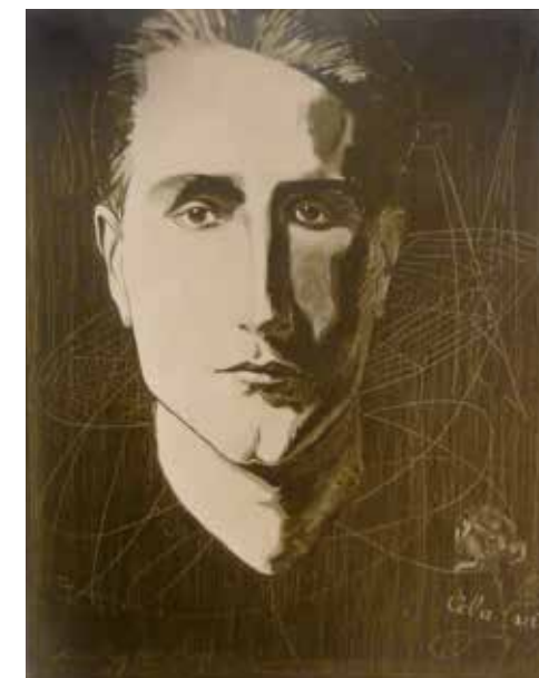
Man Ray. Cela vit , c. 1923 Gelatina de plata 20 x 16 cm Col·lecció Fundació Vallpalou, Lleida

Picabia, després d'un període pictòric cubista i futurista, liderà el moviment dadà i publicà revistes com Cannibale (1920) i col·laborà amb els seus dibuixos a la revista Littérature, nouvelle série , dirigida per André Breton des de 1922 i fins al 1924. El 1917 publicà el primer número de la revista dadaïsta 391 a Barcelona. La coberta és una màquina que titulà NOVIA. El 1922 exposa a les galeries Dalmau de Barcelona una exposició de Màquines i Espanyolas i el catàleg du un prefaci d'André Breton.