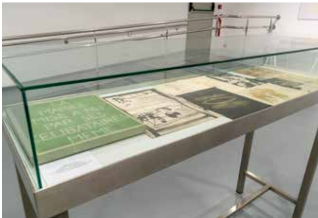
Marcel Duchamp. La Mariée mise à nu par ces célibataires / Green Box , 1934 Col·lecció Fundació Vallpalou, Lleida

L'any 1913, el Nu Baixant l'escala de Duchamp, que s'havia exposat a les galeries Dalmau de Barcelona un any abans a l'exposició d'Art Cubista, triomfà a la mostra de l' Armory Show de Nova York. Man Ray i Duchamp es coneixen a Nova York el 1915, allà coincideixen amb el fotògraf Alfred Stieglitz,